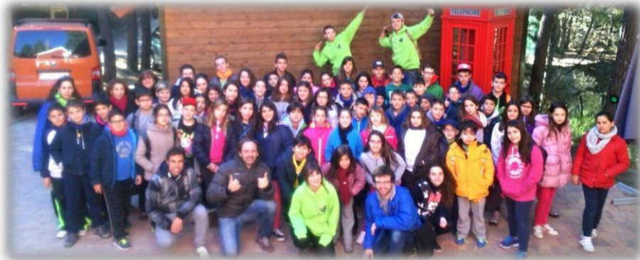
ENGLISH IMMERSION TRIP