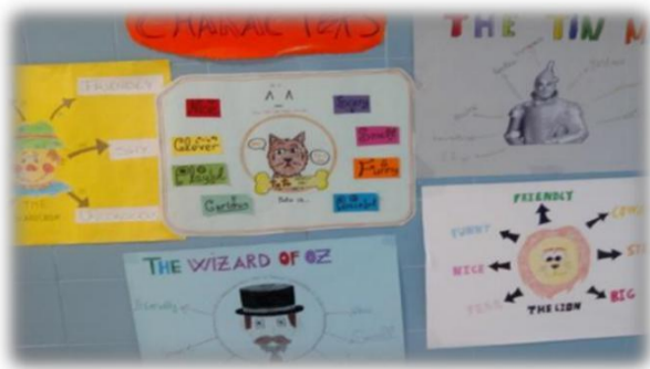
WORLD BOOK DAY