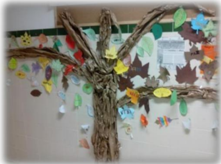
INTERNATIONAL DAY OF PEACE