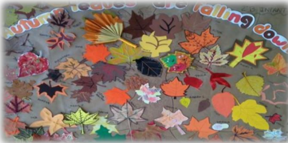
4 SEASONS POSTERS