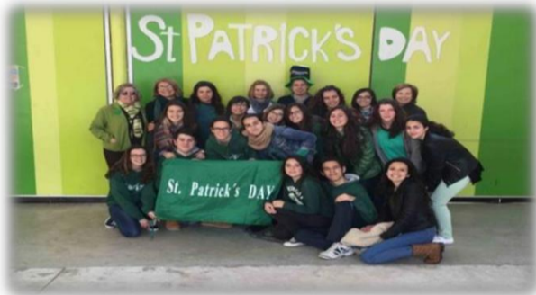
SAINT PATRICK'S DAY